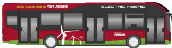
Electric Hybrid (plug-in) buss för linje 73 i Stockholm

En plug-in 3 buss är en buss som i huvudsak kör elektrisk men den kan vid behov eller vid störningar av olika slag utnyttja hybrid drift. Plug-in bussen laddar el från elnätet vanligtvis vid ändhållplatserna. Anslutningen till nätet sker automatiskt när bussen står stilla, vid laddstationen. Bussen har batterikapacitet för att klara 70% eldrift på årsbasis. Plug-in bussen kan alltid följa den vanliga tidtabellen, rusningstrafik och oväntade störningar minst lika bra som en vanlig diesel eller gas buss, eftersom den kan utnyttja hybriddrift. Vid hybriddrift används en motor med biodiesel i kombination med en elmotor. En plug-in buss har samma eller högre passagerarkapacitet som en dieselbuss och högre kapacitet än en gasbuss.